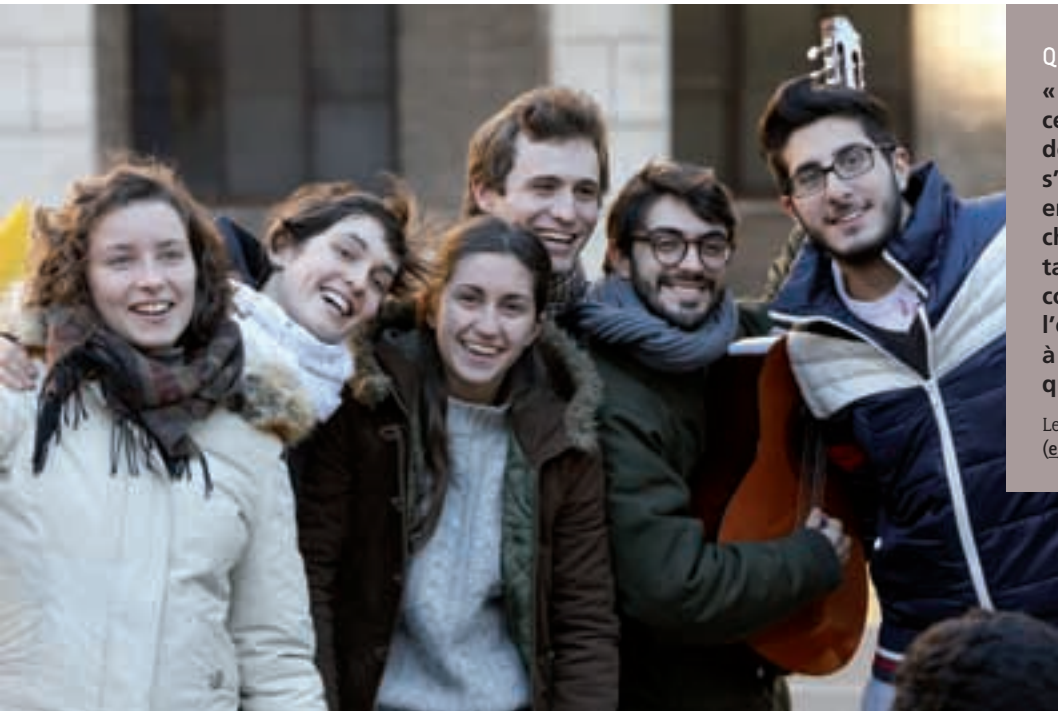
Pascal Delauche © GoLang