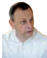
Frère Alois, Prieur de la Communauté œcuménique de Taizé

Aujourd'hui, la foi en Dieu est de plus en plus souvent mise en question. La simple pensée que Dieu existe semble devenir plus difficile. Dans un univers dont nous connaissons toujours mieux la complexité et l'infinité, comment imaginer une omniprésence de Dieu, qui s'occuperait tout à la fois de l'univers et de chaque être humain en particulier ?