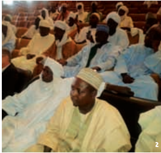
1 France Rencontre avec l'imam de Créteil 2 Tchad Conférence à Ndjaména en présence de 80 imams