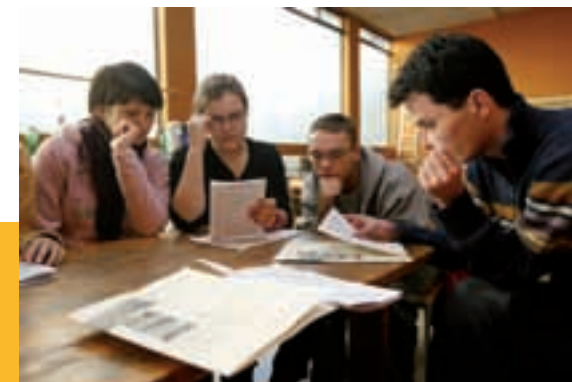
Pascal Deléche © Cefang

Les textes proposés dans la première partie de ce document sont propices à la réflexion et à l'échange et visent avant tout à enrichir notre cheminement spirituel tout au long du carême. Ils peuvent faire l'objet d'un temps d'échange en groupe ou en communauté. Il vous suffit pour cela de photocopier un ou plusieurs de ces textes en fonction du nombre de participants et après un temps de lecture seul, d'inviter chacun à réagir à partir des questions suivantes.