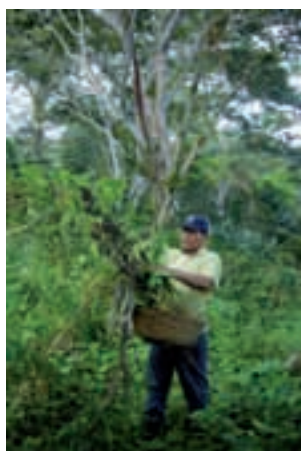
Cécile Huré © CCFD-Terre Solidaire

Jean-Paul II, Encyclique Sollicitudo rei socialis , § 42